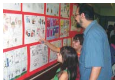
"Viajando pelo Mundo da Leitura", apresentado pela 1ª Série