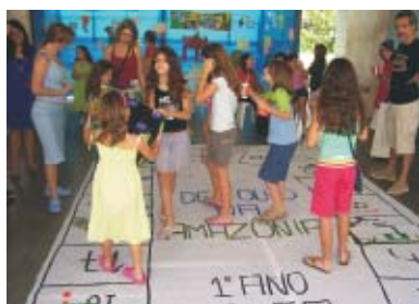
O Alfa brincou de amarelinha com "Curiosidades da Amazônia"