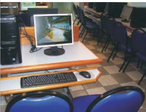
O laboratório Azul, novinho em folha (acima), em uso pelos Alunos da 2ª Série (ao lado)