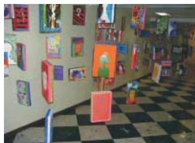
A instalação da 6ª Série "Através do Espelho"