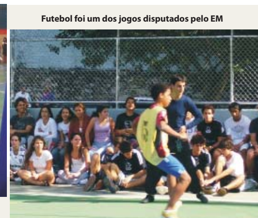
Futebol foi um dos jogos disputados pelo EM