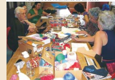
Na grande mesa são feitas peças de artesanato