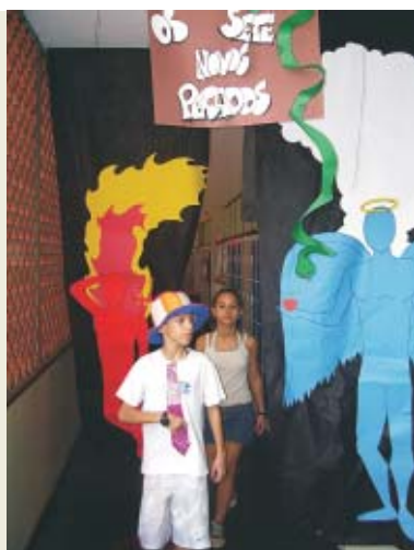
"Os Sete Novos Pecados do Séc XXI" foi o tema do 3º Ano

Ao final da feira, todos ajudaram a soltar os balões do criativo trabalho "2007: uma Viagem para o Espaço", da 1ª Série