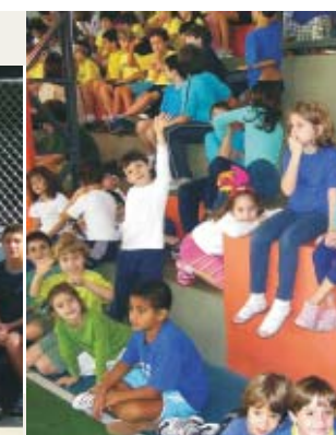
Evento lotou a arquibancada