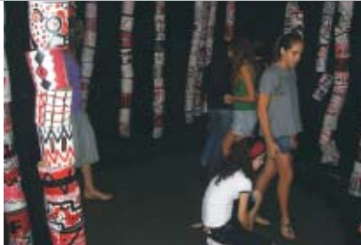
"Poética do Grafismo Indígena", trabalho da 5ª, 6ª e 7ª Séries