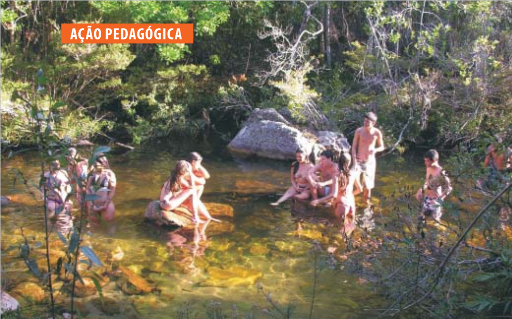
1º e 3º se integraram nos passeios, como no Banho do Belchior