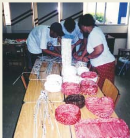
Cestaria recicla papel-jornal na oficina com Alunos da EJA

Sobre o churrasco, tudo o que dissermos não será capaz de exprimir a alegria com que é recebido e saudado este evento. Nossos Alunos e Alunas e os Monitores do Ensino Médio, de modo especial, sentem-se não só gratificados como honrados por se saberem tão queridos. E cremos que retribuem com sua presença afetuosa e intensa nas cinco horas que dura a festa, este ano iniciada com