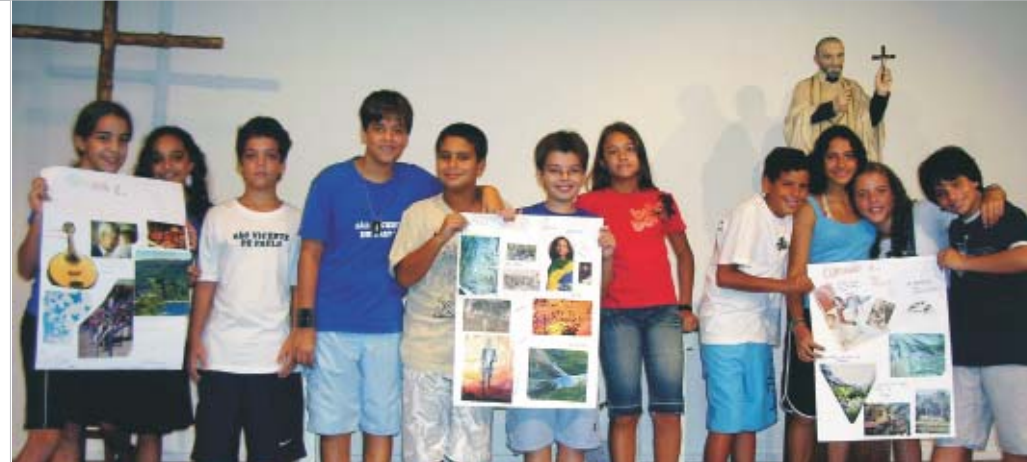
Grupos de Alunos e seus trabalhos, desenvolvidos nas aulas preparatórias

A APM conclui o ano de 2007 com duas atividades: o tradicional churrasco dos aniversariantes do segundo semestre e a excursão ao Caraça com Pais e Famílias de Alunos do nosso Colégio, cinco dias de integração, brincadeiras, caminhadas, banho de cachoeira, visão de lindas paisagens e a famosa visita do lobo-guará.