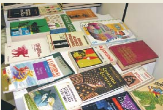
Sebão: livros doados foram oferecidos a R$ 1,00