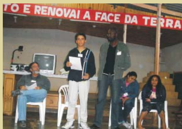
Apresentação de trabalho de grupo