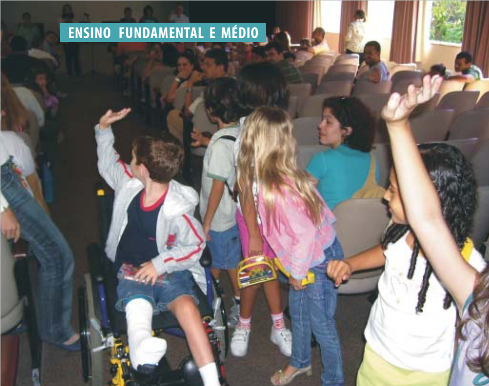
Crianças se despedem dos Pais para seguirem com seus novos amigos