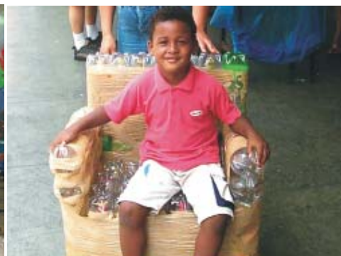
Menino experimenta poltrona feita com PETs após participar de oficina