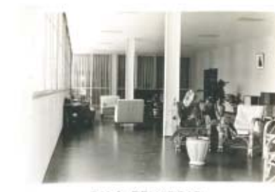
SALA DE VISITAS