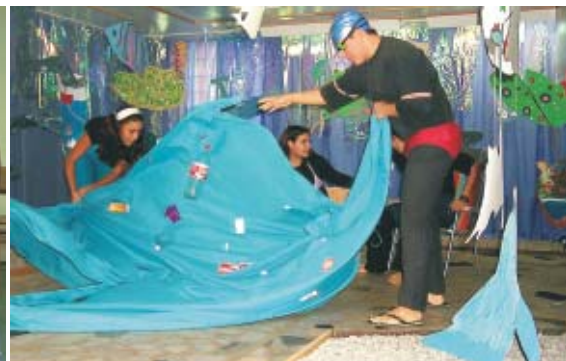
Dramatizando o recolhimento do lixo marítimo: vivência na Feira da Linguagem