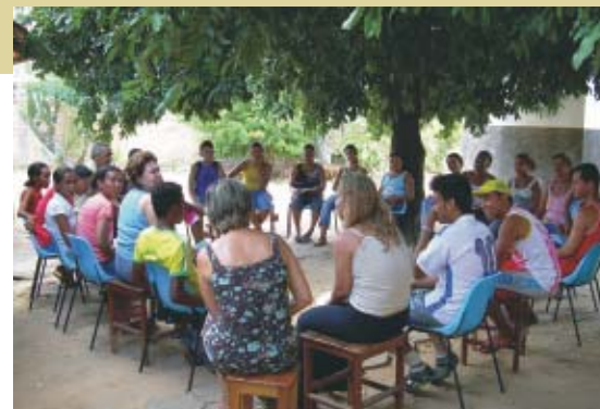
Encontro de moradores de São Lucas

Já o projeto “Liderança e Atitude” tem como objetivo principal facilitar o desenvolvimento de habilidades e competências de lideranças pastorais e de movimentos para o trabalho como agentes de