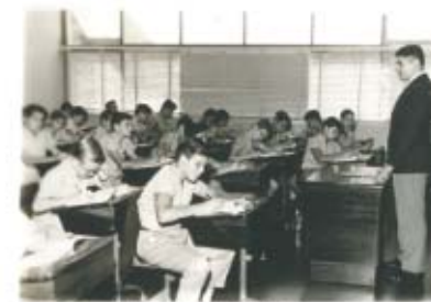
AULA DO GINÁSIO