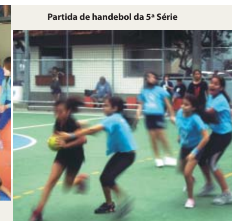
Partida de handebol da 5ª Série