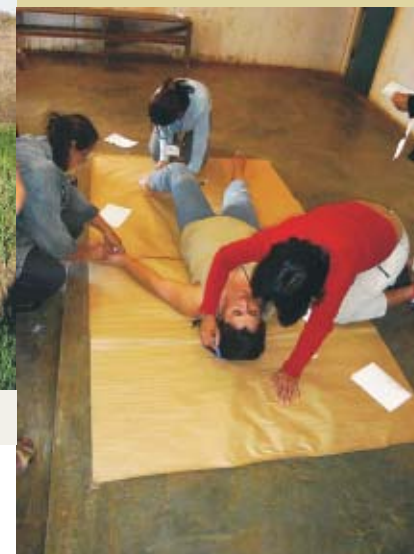
Atividade realizada com as lideranças em Riacho Fundo

O CPF engloba vários projetos, com diferenciados caminhos. Primeiramente, capacitar os Professores dessas cidades e conscientizar a população local. Os Professores dessas localidades não precisam possuir Ensino Superior completo. As escolas da região só oferecem cursos até a antiga 8ª Série do Ensino Fundamental. O Ensino Médio é feito