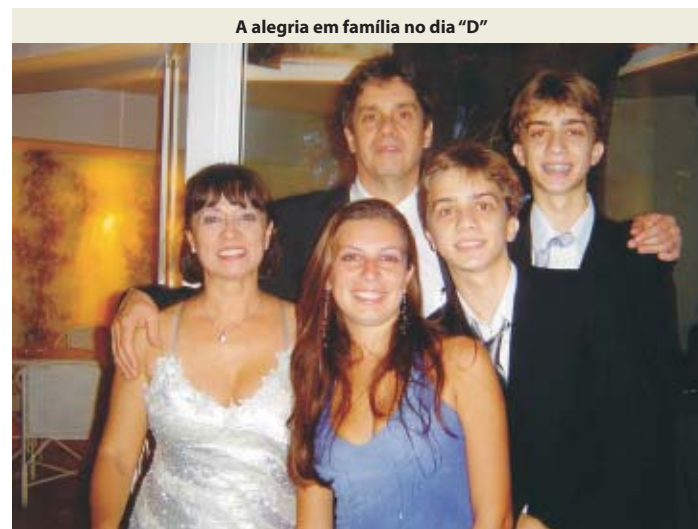
A alegria em família no dia "D"