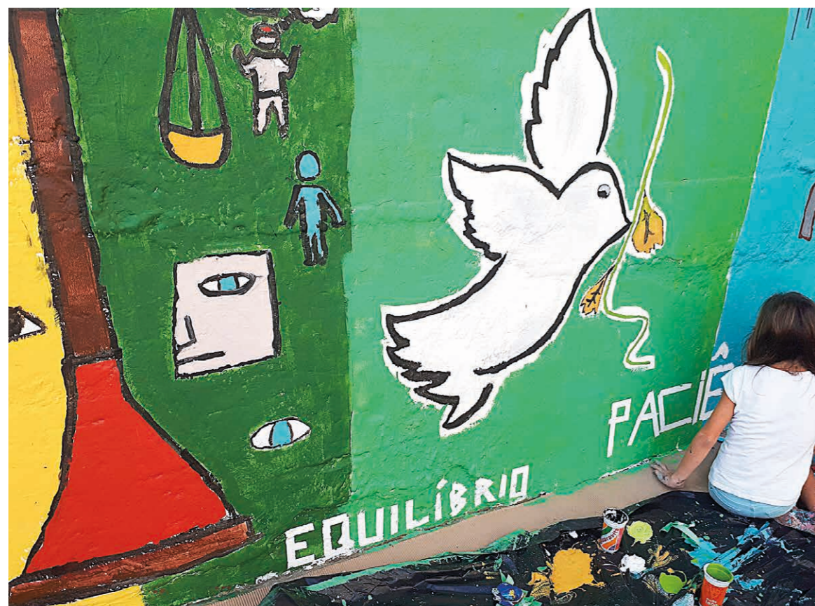
Do 6º ao 8º ano do Fundamental, o tema da pintura do muro deste ano foi Forças de resistência contra a violência